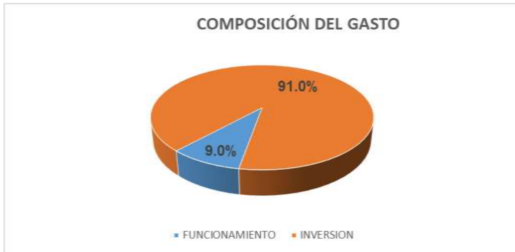
GRÁFICO Nº 2 AEROPUERTO INTERNACIONAL MATECAÑA VIGENCIA 2019

La ejecución del gasto se estructuró así: en Gastos de Funcionamiento el 9.0% y en inversión el 91.0%